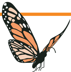
Algodoncillo de mariposa